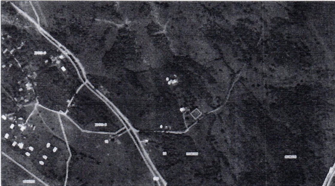
Каталог координат (МСК-20)

Схема расположения земельного участка на кадастровом плане территории Местоположение: ЧР, р-он Ножай-Юртовский, с. Сая-Сант, ул. Южная, б/н Категория земель: Земли населенных пунктов Разрешенное использование: Под индивидуальное жилищное строительство Общая площадь земельного участка: 1000 кв.м. Кадастровый квартал: 20:09:6302000 Условный номер: :3У1